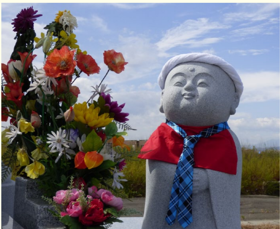
ねじりはち巻きをした名取市の童子地藏

設会社の前庭で皆を守るお地藏さんがある。どこにあって、震災で受けた悲しみを受け止めるに留まらず、復興されたまちで新たに歩み出す人々の暮らしを守りながら、悲しみと繁栄を繋ぐ心の語りべとしての役を担ってくれているのかもしれないと思いつつ、帰路について、がんばろう東北！ (文・広報担当 小田嶋豊)