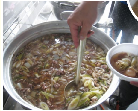
山形の芋煮はしょう油味