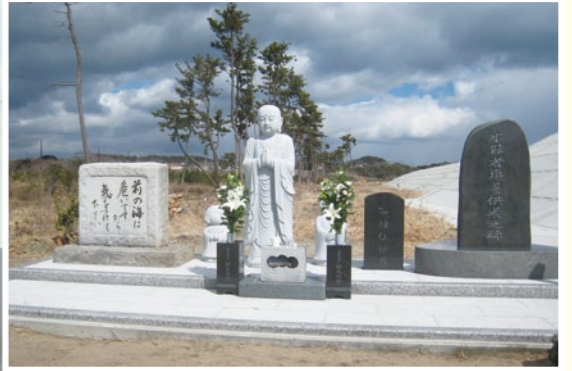
穏やかな海風に揺れる松、いつまでも続けとお地藏さん