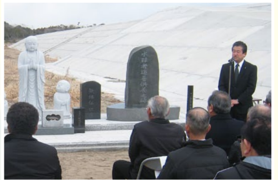
再建された水難者供養塔