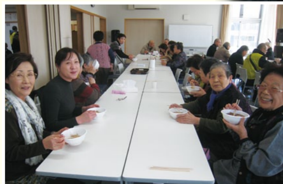
浜風の冷たい日、暑い芋煮が腹にしみました！