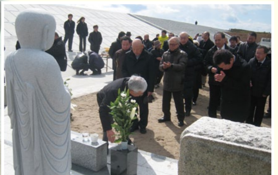
ふりかえりと未来に手を合わせる皆さん