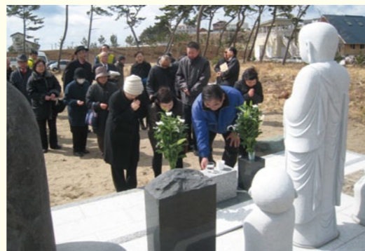
海辺に住む人々の暮らしの知恵の中には、豊潤な海から得る糧への感謝の仕方や怒る海への対処の仕方があって代々語り継がれています。各地で建造されている壮大な防潮堤は、海の姿と人間の営みが相互に見えなくなる、知恵のやり取りができなくなるのではと心のどこかで思っておりまして。「現実には人や家を失ってみっどさあ若者さこの苦しみを繰り返させてなんねって気持ちになんのか」。絆親睦会で、提供した山形のソウルフード「芋煮」を食べながら、笑顔で振り返るまでになった6年間の道程の辛さ、厳しさを改めて感じた次第です。