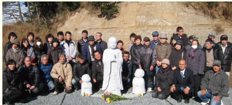
南相馬市に建立されたお地藏さん